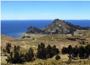
Santiago de Okola 📍