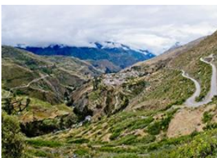
Santiago de Okola 📍 🚗 150km - ⌚ 5h 30m Kanisaya (3870m alt.) 📍