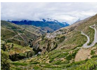
Santiago de Okola 📍 🚗 150km - ⌚ 5h 30m Kanisaya (3870m alt.) 📍