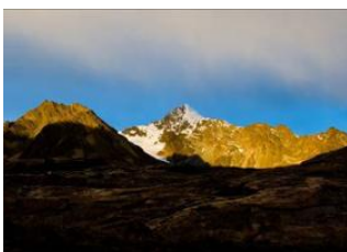
Camp Cololo (4680m alt.) 📍 - ⌚ 2h Camp de base Huanacuni (5020m alt.) 📍