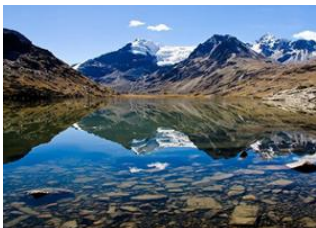
Camp Cololo (4680m alt.) 📍