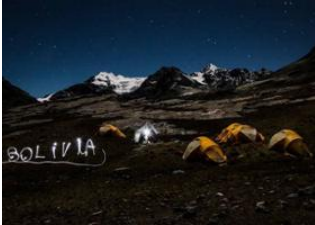
Laguna Pujo Pujo (4655m alt.) 📍 - ⌚ 8h Camp Cololo (4680m alt.) 📍