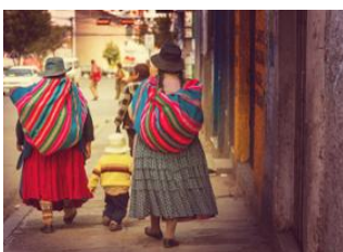
La Paz 📍