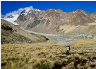
Camp Cololo (4680m alt.) 📍 - ⌚ 2h 30m Camp haut Cololo (4960m alt.) 📍